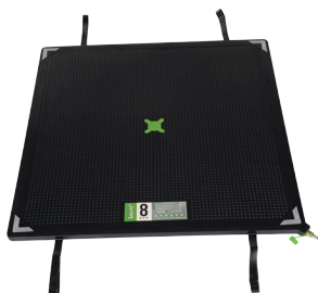
SLK 8 barů

LEHČÍ VAKY PRO SNADNĚJŠÍ MANIPULACI (AŽ O 15%)