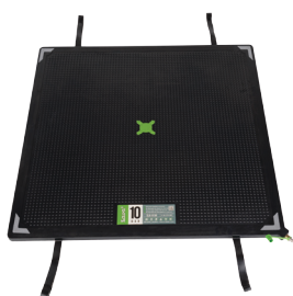
SLK-H 10 barů