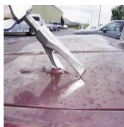
3. Stříhání kovů