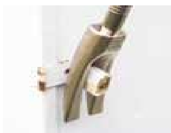
2. Odstranění zámku