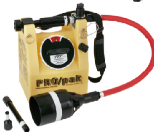
PRO/pak s příslušenstvím